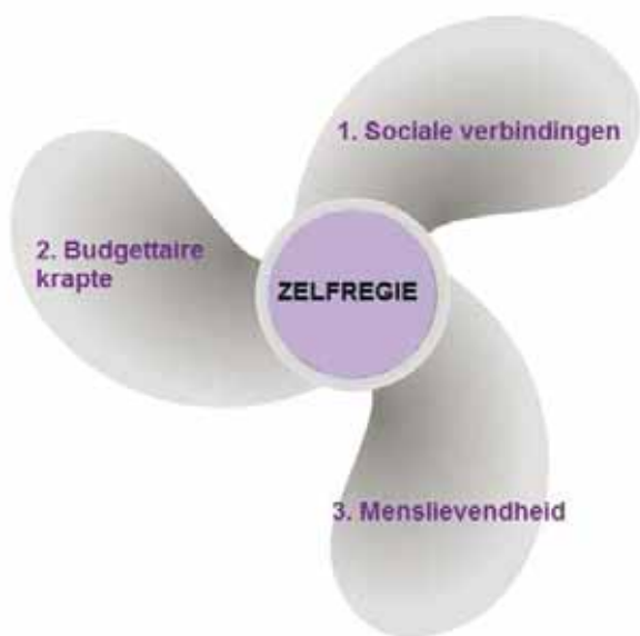
De schroef van zelfregie.