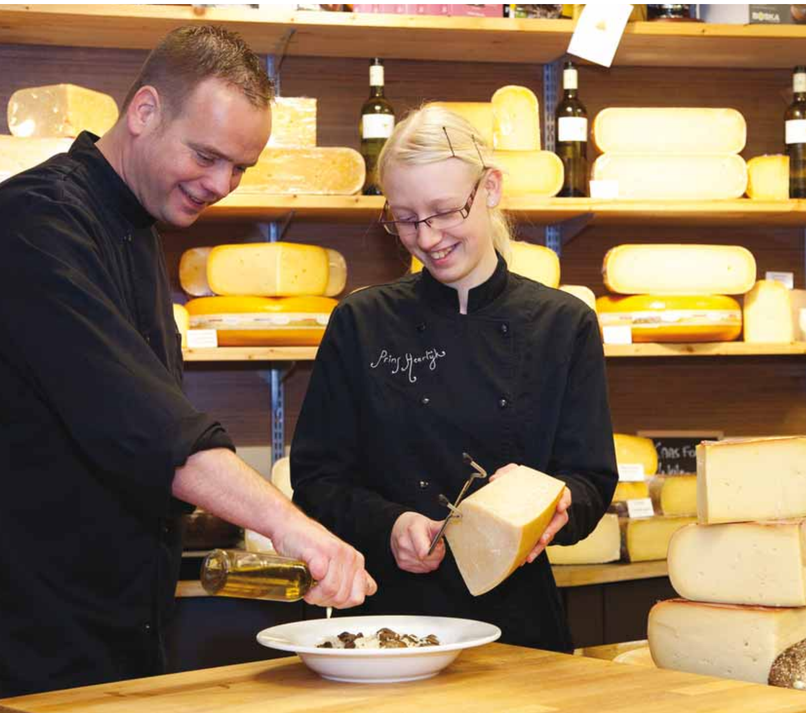
Een leerling met een leermeester in Prins Heerlijk's eigen kaas- en delicatessenwinkel aan het Stadhuisplein in Tilburg.

De drie krachten komen samen in een model dat wij noemen 'de schroef van zelfregie' (zie figuur 1). In elke situatie waarin wordt gestreefd naar meer zelfregie en eigen kracht is één of meer van de krachten van de schroef actief. De hamvraag is telkens: worden de krachten op de juiste manier ingezet? Past wat we nastreven bij de manier waarop we het aanpakken?