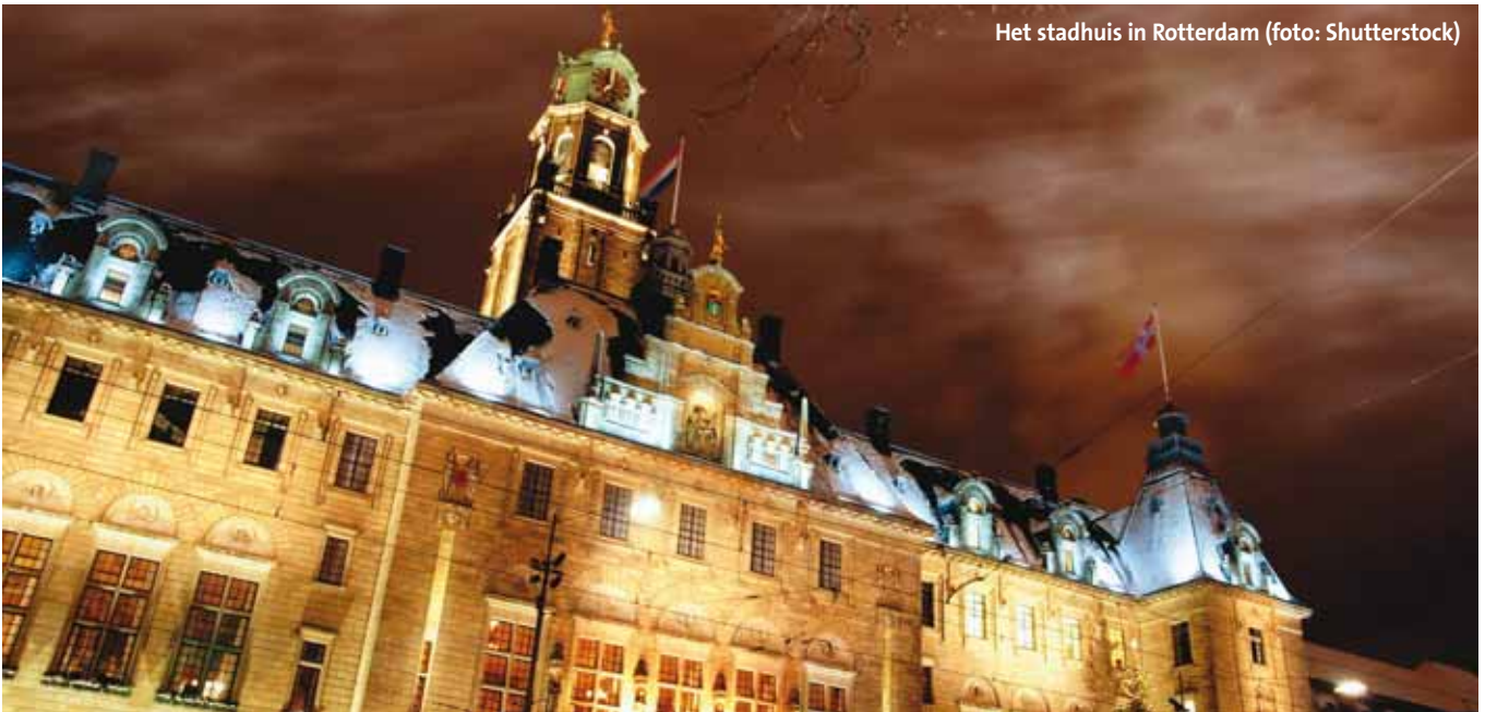
Het stadhuis in Rotterdam

De oude Grieken begrepen dat al en gebruikten hiervoor marktpleinen. Die pleinen hebben wij ook nog, zowel fysiek als online in de vorm van platforms. Gemeenteraadsleden, stap eens uit al die commissies en ga uw gemeente in, op zoek naar wat er leeft op het plein. Zo krijgt u mee wat nodig is voor uw richtinggevende en controlerende rol. Dit vergt wel een andere werkwijze in fracties en een discussie over de taak- en rolverdeling tussen fractievoorzitters en raadsleden. Het vergt dus lef.